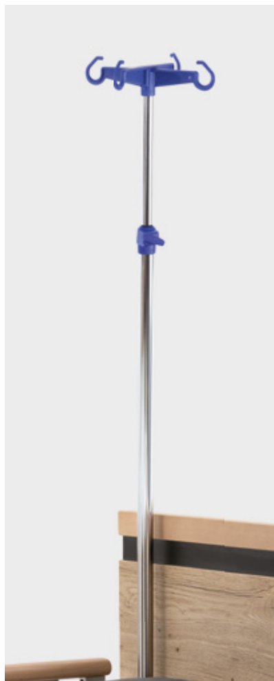
Infusionsstativ gerade Kunststoff Artikel-Nr. V80300000001