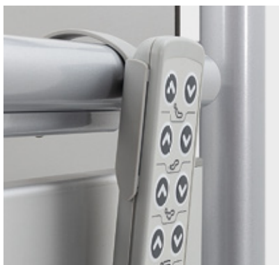
Handschalter-Haken für HC-146/147 zum Einhängen an das Seitengitter, Kunststoff Artikel-Nr. E22400102000