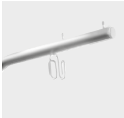
Aufrichter mit Infusionshalter RAL 9006 (silber) Artikel-Nr. V50200000007