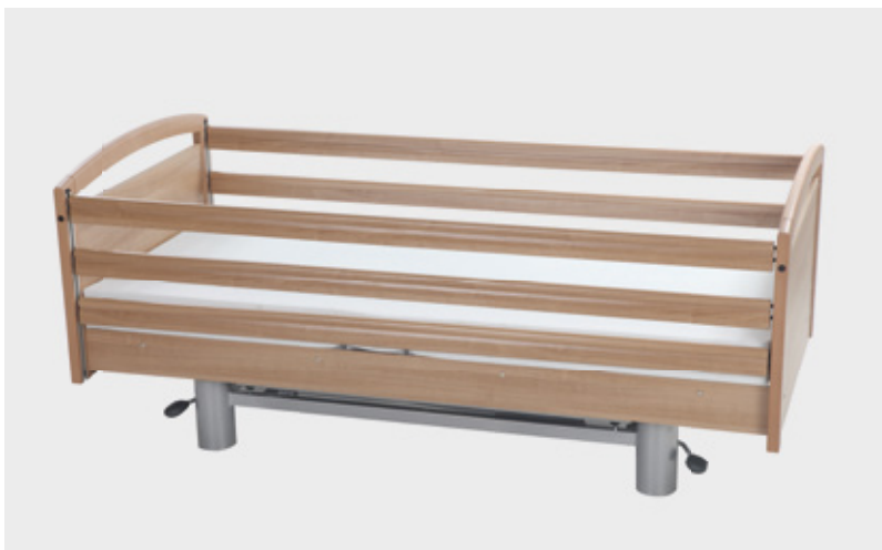
Durchgehendes Seitengitter 3-teilig Artikel-Nr. E6050010