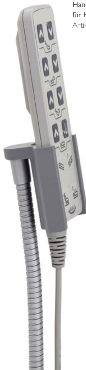
Handschalter-Halterung für HB 400 , Kunststoff Artikel-Nr. PMF81900000008