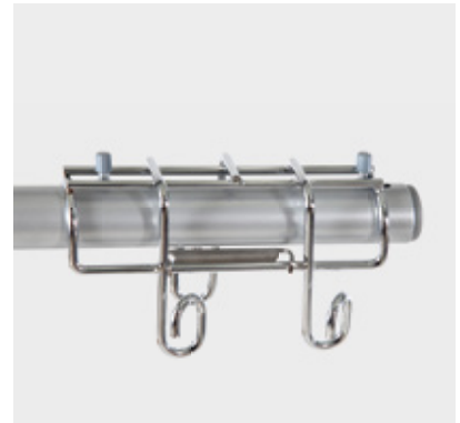
Infusionsspanne für Aufrichter verchromt Artikel-Nr. V81110000001