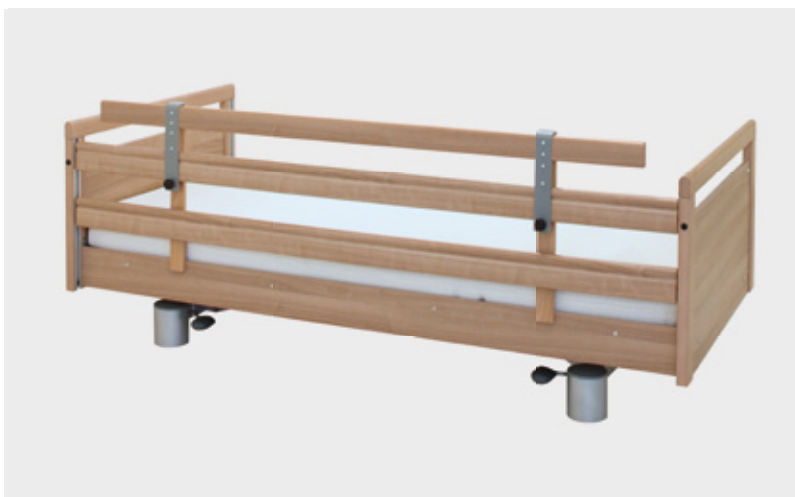
Seitengittererhöhung Artikel-Nr. V701001