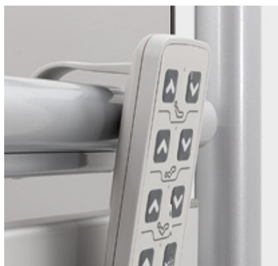
Handschalter-Haken für HB 400 zum Einhängen an das Seitengitter, Kunststoff Artikel-Nr. E22400103000